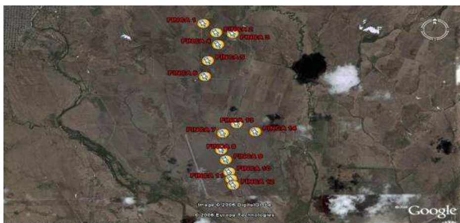
Fig. 1. Ubicación y distribución espacial de las 14 Fincas Forestales integrales de Paraguay, 2008.

La principal actividad socioeconómica de esta localidad es la agroforestal.