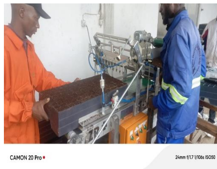
Figura 2. Sembradora industrial

Las semillas fueron obtenidas del sector semillero de la Empresa Esplendor Forestal, con origen controlado y sometidas a análisis de calidad fisiológica en laboratorio, incluyendo pruebas de germinación y vigor. Para la siembra se utilizó una sembradora industrial (Figura 2), para lograr que las semillas fueran colocadas uniformemente a la misma profundidad, y cubiertas con el sustrato, en un espesor equivalente al doble del tamaño de la semilla.