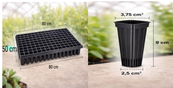
Figura 1. Bandejas utilizadas para la producción de posturas de E. urugrandis

Se utilizaron bandejas con tubetes plásticos con unas dimensiones de 80 cm de largo y 50 cm de ancho (Figura 1). Cada bandeja poseía 128 tubos en forma de pequeños vasos con 3,75 cm 2 en la parte superior, 2,5 cm 2 en la parte inferior y 11 cm de largo, adecuados para la producción de plántulas forestales, según las recomendaciones para la producción de plántulas en viveros (Silva et al. , 2019).