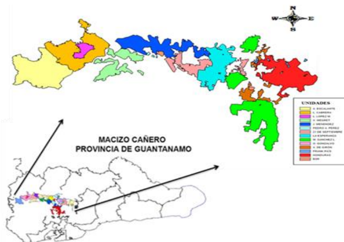
Figura 1. Representación geoespacial de las unidades cañeras en la Empresa Agroindustrial “Argeo Martínez Figueredo” en Guantánamo.

La representación geoespacial de la Empresa y las unidades que la forman, se presenta en la figura 1 .