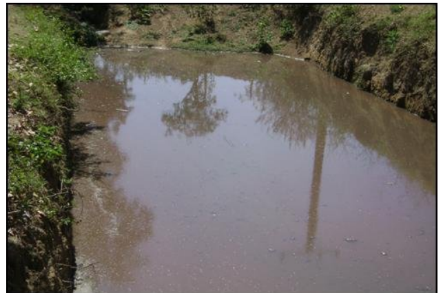
Fig. 1 Foso usado como laguna de oxidación.

Las ventajas económicas que favorecen la creación de estos convenios con el estado han provocado un aumento sustancial de la masa porcina y ganadera en toda la provincia y con