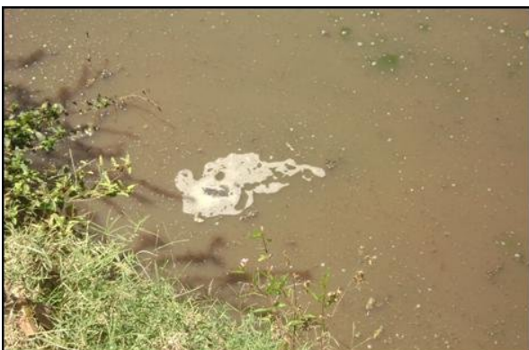
Fig. 2 Fermentación espontánea de metano.

sólidos que se producen diariamente, dígame excreta animal, la cual no se trata adecuadamente y cuyo fin es un foso común mal llamado laguna de oxidación, que no